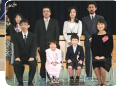
▲湯原小学校入学式