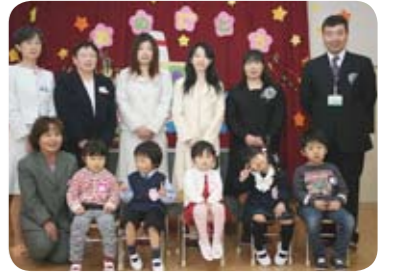
▲湯原保育所入所式