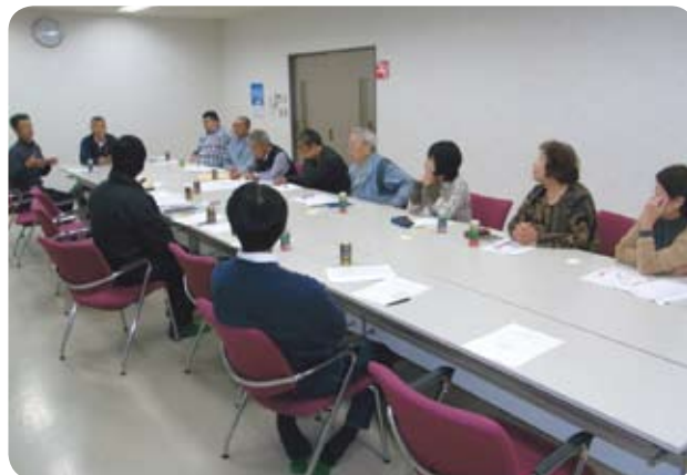
▲関上地域づくり委員会

国道113号沿いでできる事業を関下地区と合同で実施しました。季節ならではの楽しみ方を研究しました。