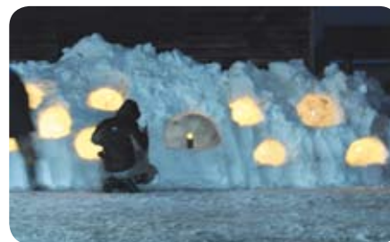
◀今後は、まとめて雪灯籠を灯していきます。

■編集と発行 七ヶ宿町総務課 宮城県刈田郡七ヶ宿町字関 126 (☎ 0224 - 37 - 2194)