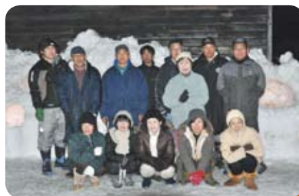
◀雪灯籠まつりの準備、大変おつかれさまでした。

竹で作った灯籠（筒）にろうそくを入れて火を灯し、雪景色に光がゆらめく、雪灯籠を行いました。