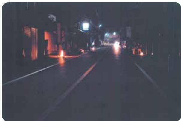
▲雨天時でしたが、ご協力ありがとうございました。

伝統的なお盆の風習である盆火（ぼんび）をみなさんのご家庭で一斉に焚く、風情ある夏のイベントを企画しました。