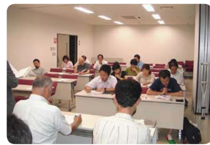
▲関地区会場の様子

東日本大震災の影響により、七ヶ宿中学校のプールが大きな被害を受け、調査の結果、修繕には時間を要することが分かりました。改修、または新設など、様々な意見はあるものの、早期に解決出来るよう検討していきたいと考えています。