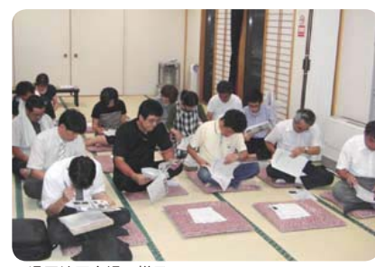
▲湯原地区会場の様子

7月12日(火)に湯原地区で、7月13日(水)に関地区で保護者、教育関係者の方々を対象に、平成23年度七ヶ宿町教育懇談会が開催されました。『七ヶ宿町教育基本方針』や、『第5次七ヶ宿町長期総合計画』の『まなぶ』の推進について意見や情報の交換を行い、教育の活性化と特色ある教育行政の推進を図るためな内容は次のとおりです。