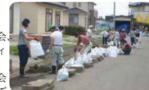
▲側溝の泥を除去する湯原自治会のみなさん