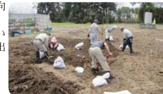
▲いちご畑のヘドロを除去する峠田自治会のみなさん