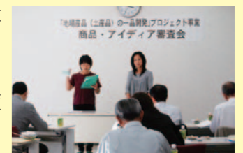
昨年の審査会の様子

審査会は農繁期が終わった11月に開催します。今から構想を練る時間はたくさんありますので、数多くの参加をお願いします。詳しいことは、10月号の広報紙でお知らせします。