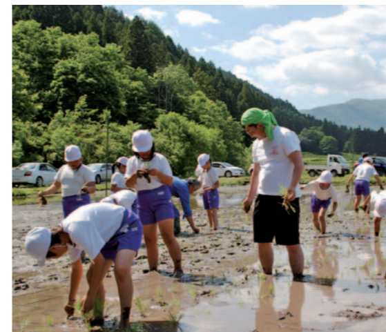
関小学校児童の田植えの様子