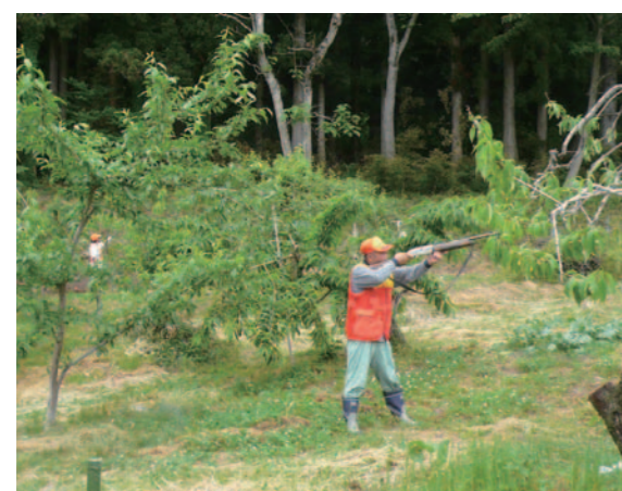
銃器及び花火による追い払いの様子