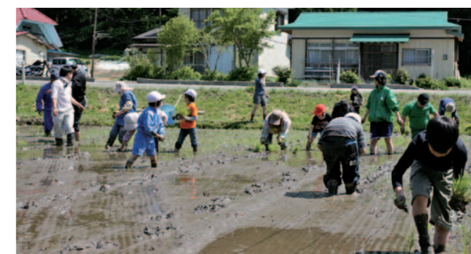
湯原小学校児童の田植えの様子