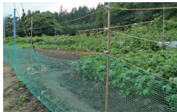
電気柵の設置をした畑