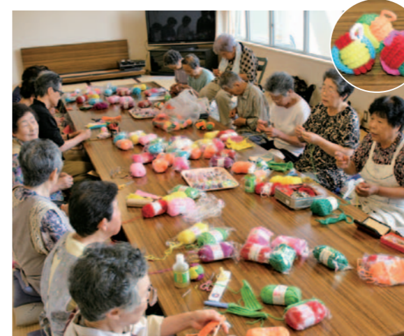
関老人クラブの皆さん