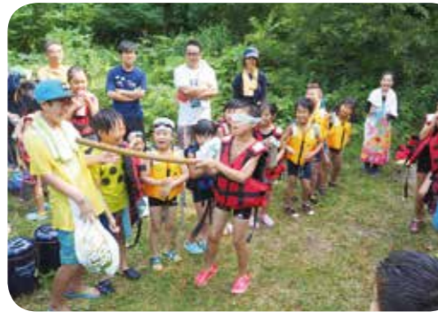
④スイカ割りでは「みぎー！ひだりー！」と元気なかけ声が飛び交っていました。