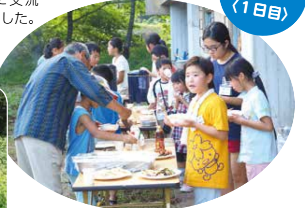
③地元野菜も登場してバーベキュー