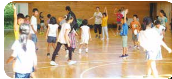
①小学校の先生方を中心に交流会を行いました。