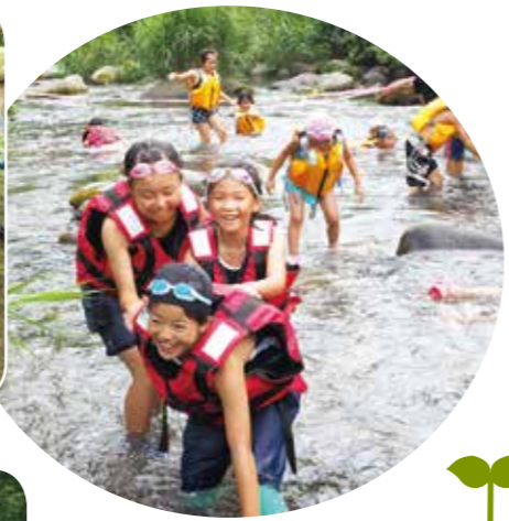
③川遊び、水の流れや冷たさなど肌で感じました。