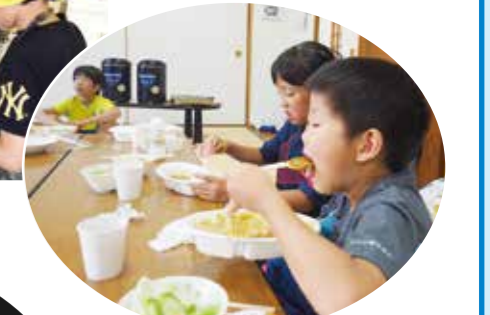
③収穫したジャガイモを使って、カレー作り。おかわりする姿が多く見られました。