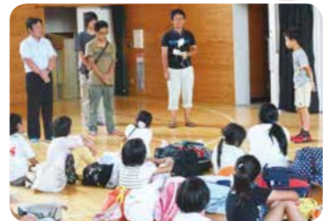
②閉村式では、4日間の感想のほかにスタッフへの感謝の言葉もありました。こうして、七ヶ宿町に来てくれたことや、出会えた縁を大切にしていきたいと思えます。