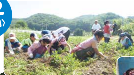
①大原の小川農園さんでジャガイモとトマトの収穫体験。ジャガイモを見つけると「あったー！」と大喜び。トマトは収穫しながら、「おいしい」と一口パクリとする場面もありました。