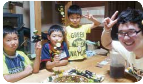
⑤民泊体験、町内のお宅でお世話になりました。