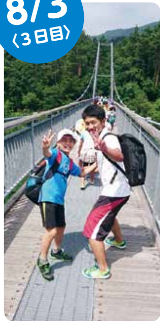
①「長老湖→やまびこ吊り橋→旅行村」ハイキング。吊り橋からの眺めや迫力に驚いていました。