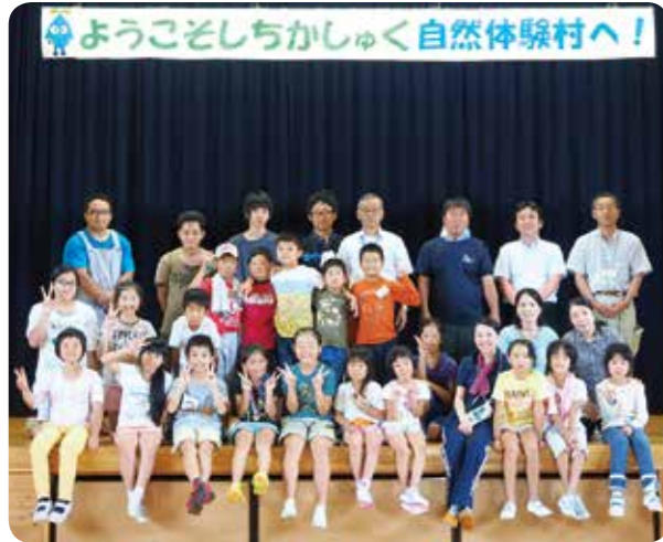
ようこそしちかしゆく自然体験村へ！