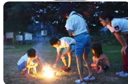
④旧湯原小学校で花火