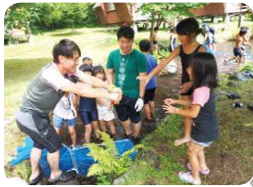
②仲間同士協力して魚のつかみ取り。