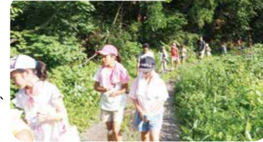
②地域散策では、旧湯原小学校の周辺を散策。地元の子どもが留学生に、地域の事などを教えていました。