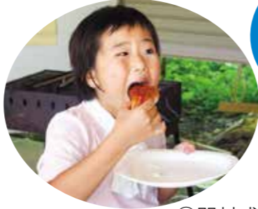
①昼食のホットドッグは、牛乳パックを使った調理法で作し、美味しいと何度も作って食べていました。