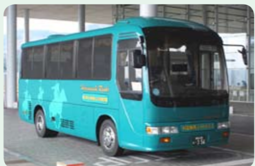
▲刈田病院シャトルバス（緑色の外装が目印）