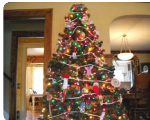
My Christmas tree on Christmas morning クリスマスの朝のクリスマスツリー

毎年、クリスマスイブには、家族と祖母の家へ行き、盛大なディナーを食べます。ディナーの後は、木の下でみんなでプレゼントを開けます。クリスマスの日には、朝に家族とプレゼントを開けて、午後には祖父の家に行きます。今年はこれまでの日本での生活を家族に伝えるのが楽しみです！おもしろい話を伝えたいと思います！私は12月27日に七ヶ宿に帰ってきて、日本で新年を迎えてみようと思います。もちの作り方を習いたいです！