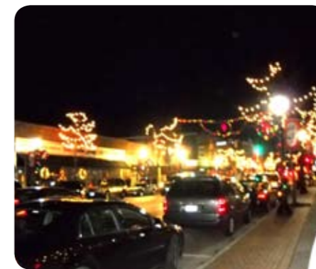
Christmas lights decorate the city! ライトで飾られた街