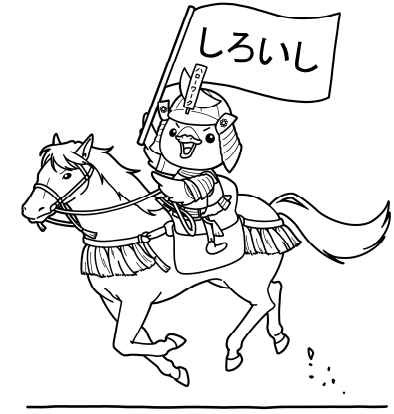
みやぎハローワークキャラクター 「ガンちょーさん」