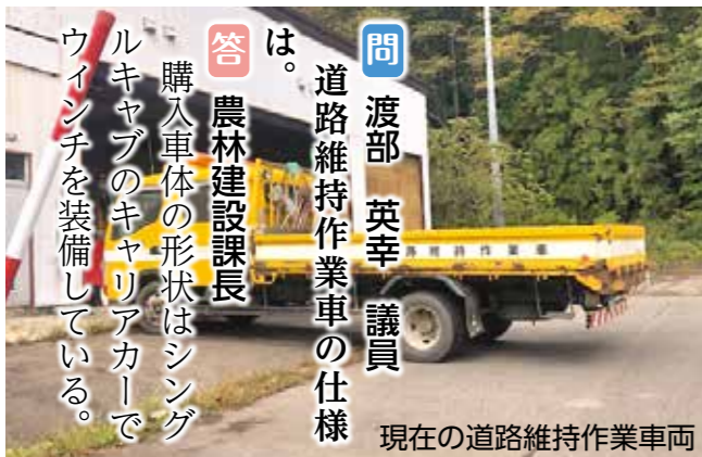
現在の道路維持作業車両

令和5年度 財産の取得 道路維持作業車 1 取得目的 町道等の維持整備のため 2 数量 1台 3 契約金額 834万1781円 4 契約相手 いすゞ自動車東北（株）宮城支社仙南支店