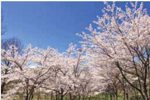
ダム公園の桜並木

私たちは、七ヶ宿の四季の変化を楽しんで過ごしています。ダム公園の桜並木はとてもきれいです。川や湖で泳いだり、木々の色の变化、雪遊び、どれもかけがえの無いものでありぜひいたく時間を過ごしているなと感じます。 七ヶ宿は人も自然も魅力あふれる町です。これからもよろしくお願いたします。