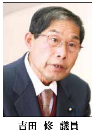
吉田 修 議員