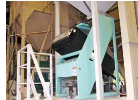
▲現在稼働中の色彩選別機

取得物件数 色彩選別機 2基 取得目的 品質確保と作業能力向上のため 契約金額 1135万2000円 契約の相手先 宮城県仙台市若林区卸町5丁目1番地の4株式会社五十嵐商会