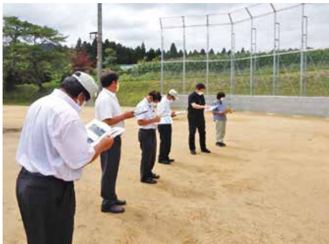
▲町民グラウンド老朽化施設改修工事