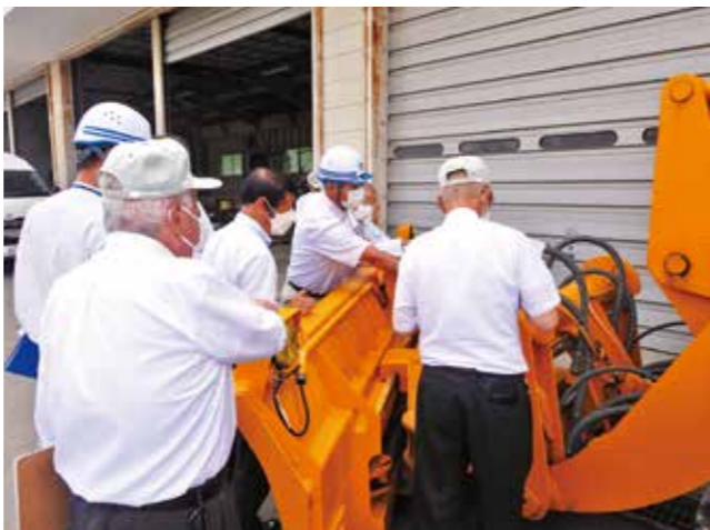
▲除雪ドーザ購入事業