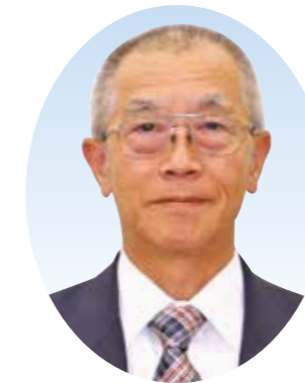
議 長 すが わら けん じ 治 管 原 研 治