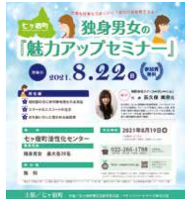
▲令和3年8月にセミナーを実施