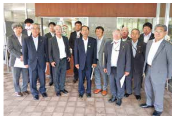
▲壮瞥町 そうべつ子どもセンター