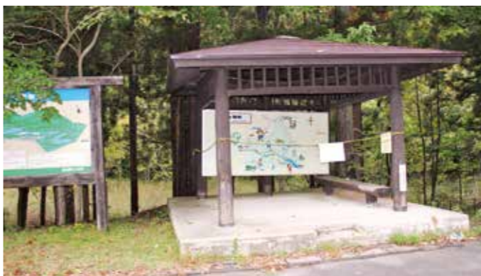
▲現在の水芭蕉群生地あずまや

答 ふるさと振興課長 築36年が経過し、度重なる豪雪への対応が不十分となっていた。