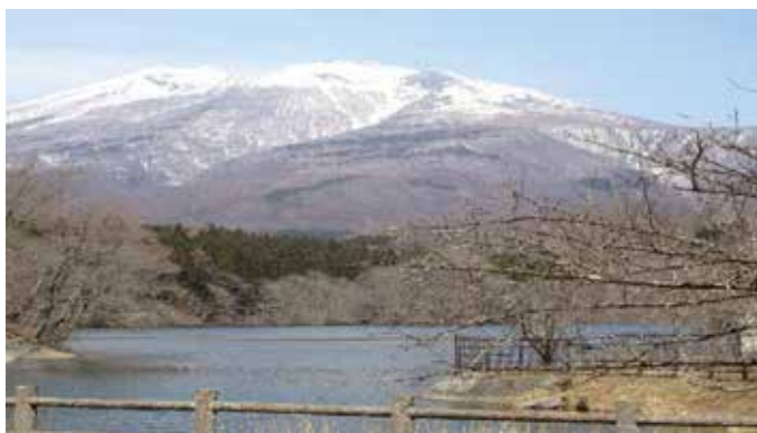
▲長老湖からの不忘山

不法投棄監視委員は総勢14名。月二回程度地区内を巡回して頂き、報告書をもとに投棄箇所を確認し11月に回収を行っている。状況に応じて不法投棄現場の確認を行うなどの連携をして参りたい。