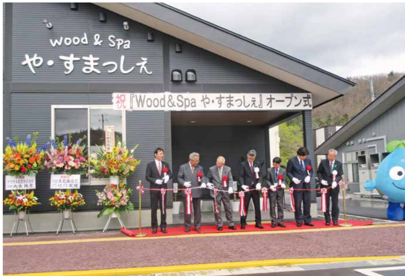
▲入浴施設『や・すまっしえ』オープン