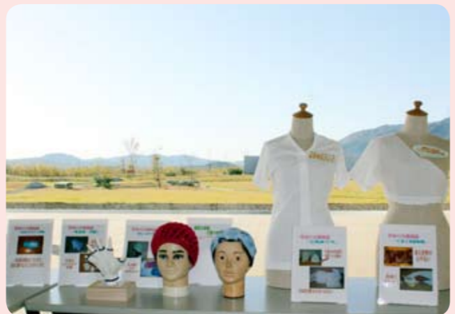
患者さんのご家族が考案された介護用品

当院1階外来4の待合一角に「(仮称) かったほっと広場」を設置しました。この広場は、病気や介護について、訪れた皆さんが気軽に話をすることができる場となることを目指し、設置したものです。現在は、患者さんのご家族が介護の経験から考案された介護用品を展示しています。今後は、患者さんやご家族の皆さんが主体となって交流を行い、この広場を利用することで“ほっと”するような気持ちを持っていただくことができると考えています。当院をご利用の際は、気軽に足を運んでいただき、この広場に対するご意見や、愛称をお寄せくださるようお願いいたします。