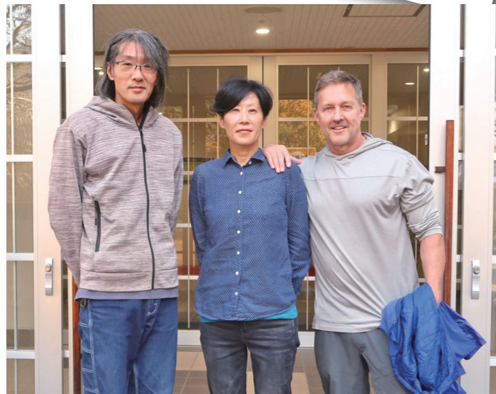
▲宿泊先の街道HOSTELおたて玄関前にて撮影

仙南地域9市町村を舞台に、ライフスタイルとキーワードからコーディネートできるセミオーダータイプの移住体験「ぐるっと」の様子を紹介します。体験するのは丸森町・川崎町・七ヶ宿町・蔵王町の4町。参加者は海外生活のご夫婦です。全3泊4日の行程のうち、3日目の夕方に七ヶ宿に到着。宿泊から翌日は町の案内を東から西まで行いました。ご夫婦は、特に奥さまの実家が仙台にあり、週末ごとに実家の母親に会いに行くことができる距離で気に入った移住先を見つけられたら、という気持ちで移住体験に参加されたそうです。案内を終えて感想を尋ねると、「実際に来訪して目で見るのが大切と思いました」ということでした。移住を検討する上で貴重な材料になったのではないかと思います。