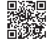
無限陶房 Instagramはこちら

気軽にモノづくり体験はいかがでしょうか。陶芸を皆さまに身近に感じてもらい、七ヶ宿ブランドとして誇りとなる工房を目指して、自ら楽しみながら頑張っています。ぜひ無限陶房のInstagramも覗いてみてください♪