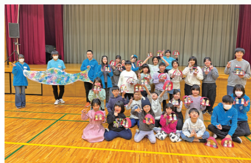
▲みんなで楽しく制作しました

2月16日に、小学生対象の「ジュニア・リーダーと遊ぶ 冬」を開催しました。ひなまつりの工作や、手形を押してみんなで大きな鯉のぼりを彩りました。ジュニア・リーダーとのレクリエーションゲームでは、寒さを吹飛ばそうと、たくさん体を動かして遊びました。汗をかいて大笑いしながら、みんなで楽しむことができました。作品は今月スタートするORADAZUの節句で展示します。