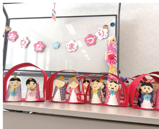
▲かわいい作品が完成！