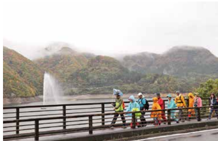
▲ダムの噴水もちょうど見られました

10月27日、七ヶ宿ダム湖畔において「七ヶ宿湖一周ウォーキング2018」が開催されました。当日はあいにくの小雨でしたが、県内外より149名の方々が参加され、七ヶ宿ダム湖周囲約12kmを歩きました。ダム南側の紅葉が見頃を迎え、皆さん鮮やかに彩られた景色を楽しんでいました。休憩所ではゆべし、ゴール後にはきのこ汁の振る舞いに、「おかわりが欲しい！」と大変好評でした。