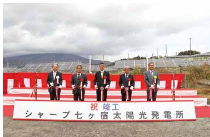
▲テープカットの様子

10月29日、町営柏木山放牧場に建設されたシャープ七ヶ宿太陽光発電所の竣工式が行われ、事業者と町の関係者ら約60人が出席し、完成を祝いました。町が合同会社クリスタル・クリア・エナジーに貸し付けた用地約30ヘクタールに太陽光パネル約4万8,800枚が設置され、20年間に及ぶ発電事業となります。町には売電収入の一部が寄付され、農林業等の振興に関する取り組みに活用していきます。