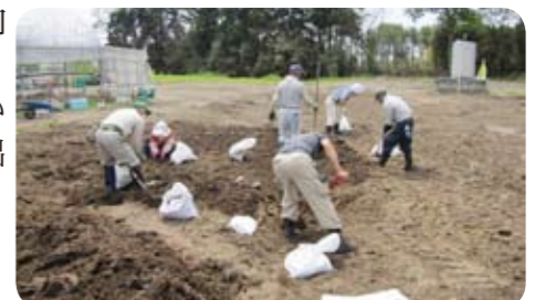
▲いちご畑のヘドロを除去する峠田自治会のみなさん