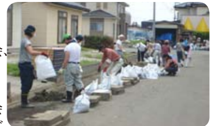
▲側溝の泥を除去する湯原自治会のみなさん