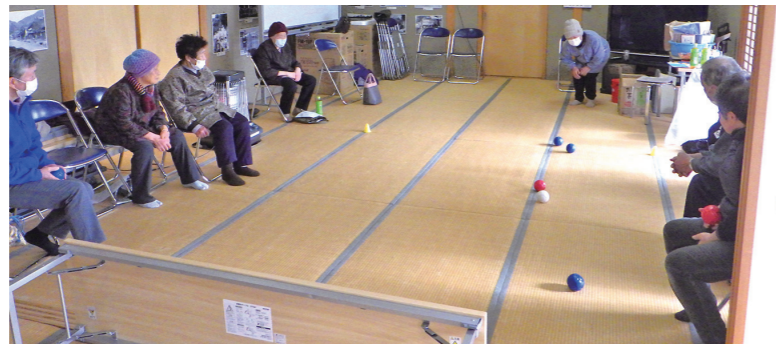
▲ポッチャ体験の様子

11月30日に干蒲地区、12月13日に滑津地区で地区ぐるみ講座を開催しました。干蒲地区では地域づくり委員会と、滑津地区では老人クラブと合同で行い、ポッチャや釣りゲームなど簡単なゲームをしながら体を動かして交流しました。