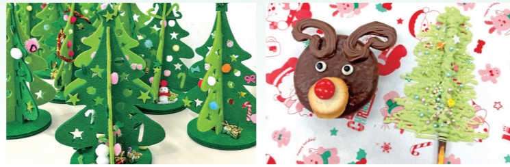
▲フェルトのツリー工作 ▲トナカイとツリーのおやつ