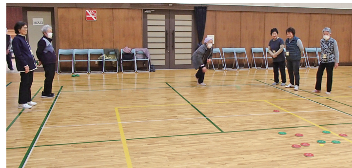
▲声援を送りながら楽しみました