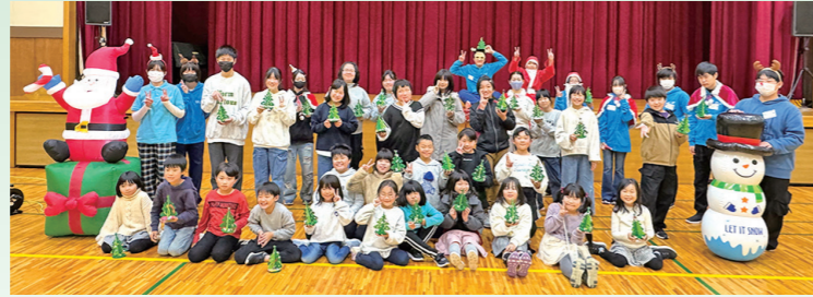
▲素敵な作品を持って大満足の笑顔でした

12月8日に、活性化センターを会場に子ども会育成会との共催で小学生対象の「クリスマス会」を開催しました。小学生29名、ジュニア・リーダー11名が参加し、クリスマスツリーの工作や、おやつ作りを楽しみました。レクリエーションゲームの時間には、ジュニア・リーダーが仙南地域の研修会で教わった新しいゲームを紹介して、盛り上がりました。小学生の高学年の子ども達も積極的にお手伝いをしてきて、みんなで楽しい会を運営することができました。