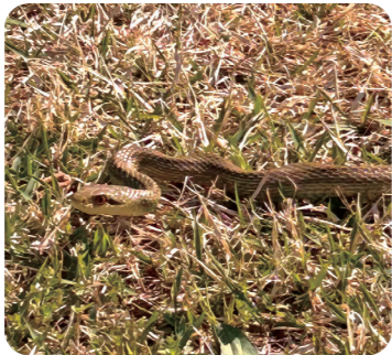
▲やまびこ場内にいたヘビ