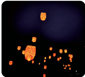
▲スキー場のイベント