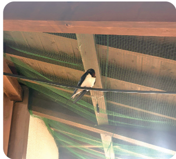
▲道の駅にいたツバメ