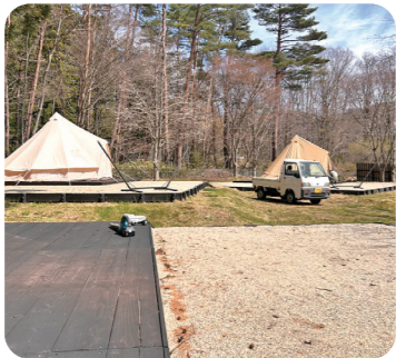
▲オープン準備の様子