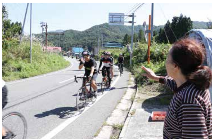
▲沿道の応援で力が出ます

9月23日、みちのくおとぎ街道の110kmを走行し、各地のご当地麺を食べ尽くす「グル麺ライド」が開催されました。七ヶ宿町では旬の市で手打ちそばと七ヶ宿産のりんごを提供し、参加者の方からは「おかわりが欲しい」と大好評でした。また、休憩所となったこ・らっしえでは焼きたてのパンやコーヒーを提供し、疲れを癒してもらいました。参加者約450名の方々に町の自然や景色、秋の味覚を満喫してもらいました。応援ありがとうございました。