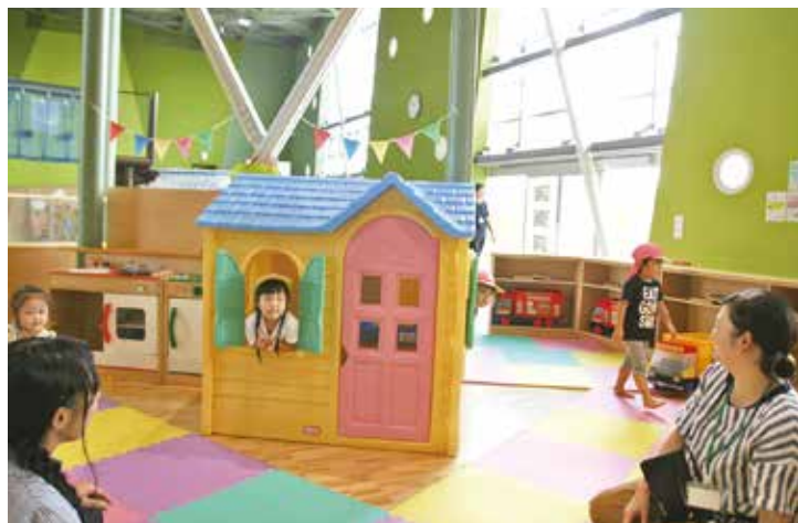
▲元気いっぱい遊びました

9月4日、関保育所の子ども達が山形県天童市「子育て未来館げんキッズ」に親子遠足に行きました。前日からとても楽しみにしていた子ども達は、種類豊富な遊びのコーナーに目を輝かせていました。お父さん、お母さんと一緒に高さ3メートルのスライダーを登って滑ったり、トランポリンをしたりと体を使って沢山遊びました。帰りには山形物産館で買い物も楽しみ、親子でゆっくりとした時間を過ごせた大満足の1日でした。