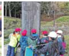
4年関用水石碑見学 〈11/27(月)〉