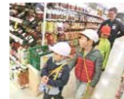
2年ファミリーマート見学 〈12/6(水)〉