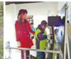
5年トヨタ工場見学 〈12/14(木)〉