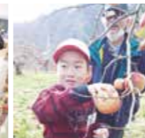
3年りんご園見学 〈12/5(火)〉