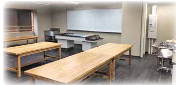
体験交流を楽しむスペース