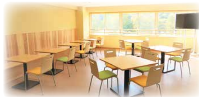
ちょっと一休みできるスペース