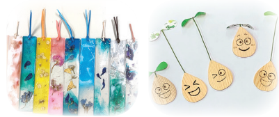
▲ドライフラワー ▲町産材の木製ポット

Book&Cafeい・らっしえ図書コーナーには、人気お笑い番組「読書大好き芸人」で紹介された話題の本や、文学賞受賞作品等、新刊が多くあります。スタンプカードの期間は令和5年3月末までとなっています。スタンプを貯めて地域の方が手作りした、素敵な「しおり」と交換しましょう。