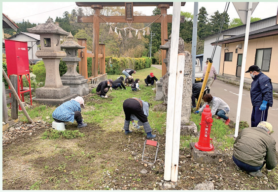
▲水分神社鳥居の除草作業の様子