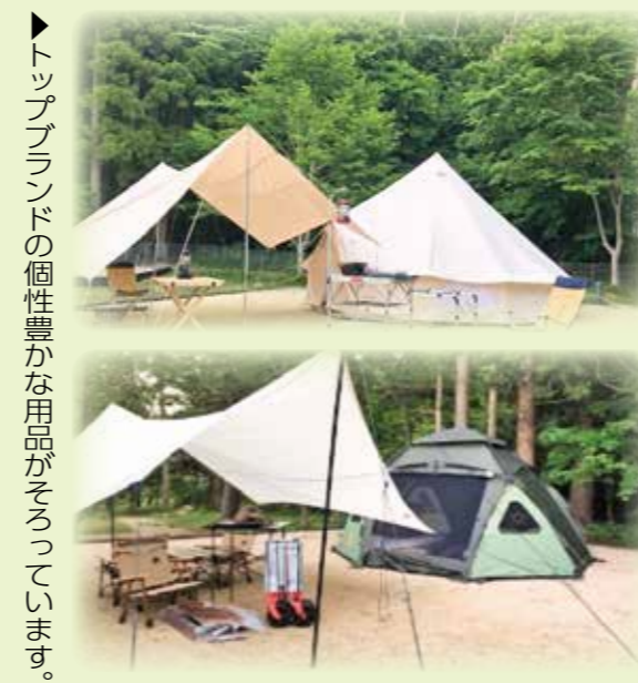
▶トッポブランドの個性豊かな用品がそろっています。

地域資源を活用した自然体験やアクティブ体験も計画中です。7月中は、オープン記念として、モニター料金でご利用できます。町内外の皆様のご利用をお待ちしております。