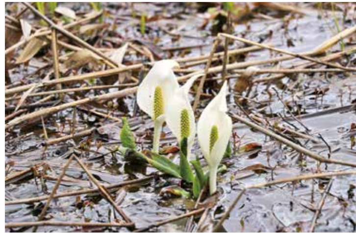
▲今年も美しい水芭蕉が咲きました

4月6日、玉ノ木原水芭蕉群生地で関係者や観光客など約40名が集まり、オープン式が開催されました。今年は4月に入ってから寒気の影響で、開花への影響が心配されましたが、残雪の中水芭蕉が咲き始め長かった冬から、七ヶ宿に春の訪れを運んでくれました。当日はテープカットが行われたほか、来場者には記念品がプレゼントされ訪れた方は、水芭蕉を楽しまれました。