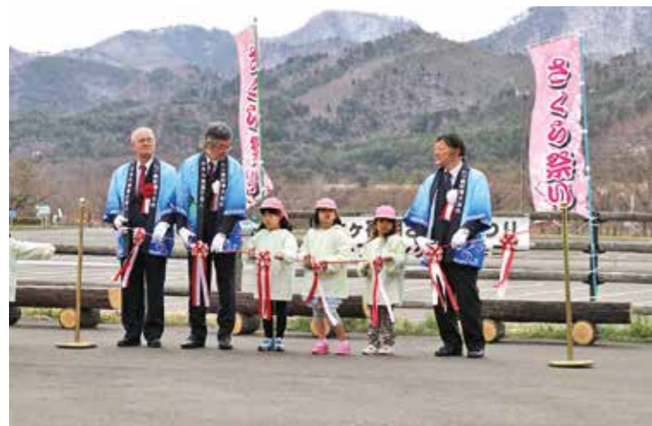
▲テープカットの様子

4月12日、七ヶ宿ダム自然休養公園を会場に、「七ヶ宿湖さくらまつり」のオープニングセレモニーが開催されました。今年は昨年よりも開花時期が遅く、“つぼみ”になりかけの桜を背景に、関係者と保育所の子ども達によるテープカット、バルーンリリースが行われ、華やかなセレモニーとなりました。さくらまつり期間中は「集まれ！はたらくくるま」のほか、道の駅前では出店を出すなど多くの観光客で賑わいました。