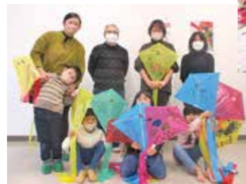
カラフルな風ができてあがり!

1月14日に、子育て支援講座を開催しました。愛島伝承風の会より武田先生をお招きして、ビニール素材のダイヤ風を作りました。好きな色のビニールにお絵描きをして、骨となる竹を貼り付けました。親子でそれぞれ大きさの異なる風を作成し、繋げて連風にして風揚げを楽しみました。昔ながらの遊びを通して、親子でふれあう時間を満喫しました。