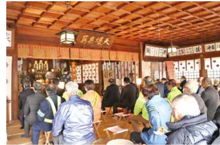
▲無事故祈願の祝詞が奏上されました

1月6日、白石市の神明社で新春祈願祭が行われました。この祭事は白石警察署管内の各交通安全機関・団体が集まり交通安全を祈願するもので、町からは交通安全協会、交通指導隊、交通安全母の会の代表者と町長が出席し、神前に玉串を捧げて今年一年の交通安全を祈願しました。現在県では「冬道の安全運転1・2・3運動」を展開中です。1割のスピードダウン、2倍の車間距離、3分早めの出発で交通事故の防止に努めましょう。