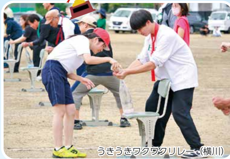
うきうきワクワクリレー(横川)