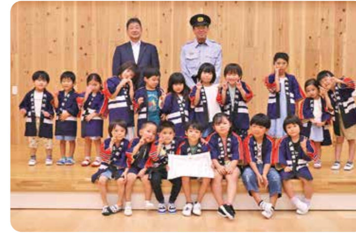
▲表彰された保育所の皆さん、おめでとうございます！

9月20日、関保育所幼年消防クラブが無火災地域推進功労団体として宮城県知事から表彰を受け、木須白石消防署長から感謝状の伝達が行われました。関保育所幼年消防クラブは、平成4年4月の結成以来、年間計画に基づき消防訓練や防火教室を開催するなど、幼年期から防火に対する意識づけが行われており、家庭及び地域における火災予防に貢献していることが認められ受賞となりました。