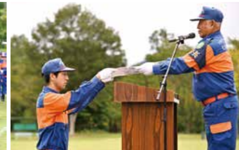
▲梅津団長による表彰状授与