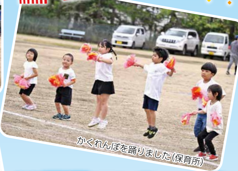
かくれんぼを踊りました(保育所)