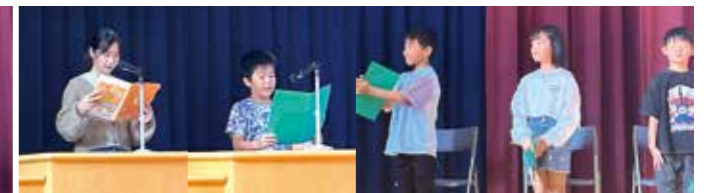
10/17(木) 第2学期始業式発表児童