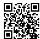
▲裁判員制度サイト

国民の皆様の積極的な参加により、裁判員制度は円滑に実施されています。引き続きご協力をお願いいたします