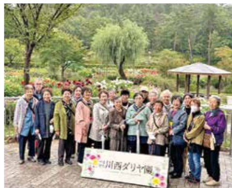
▲綺麗なダリアに負けない皆さんの笑顔

10月9日、山形県へお出かけして、川西ダリア園での散策やぶどう狩りを楽しみました。当日は時折小雨の降る中でしたが、綺麗に咲き誇ったダリアを見て皆さんの会話にも花が咲いていました。飯豊町の道の駅にも立ち寄り、食材を見ながら調理法など様々な情報交換を楽しんでいる様子でした。南陽市の熊野大社で開催されていた菊まつりでは、お詣りをしつつ特別に飾り付けられた菊の花の展示を見るのが出来ました。最後においしくて新鮮なぶどうを食べて、笑いの絶えない一日となりました。