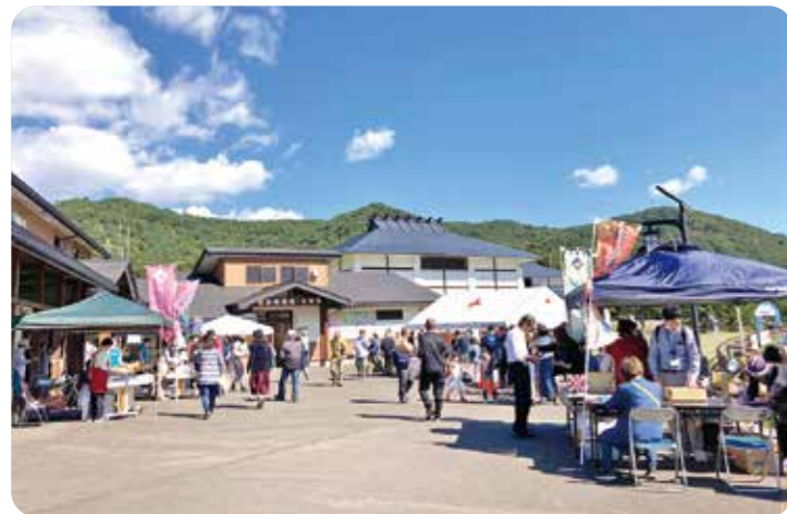
▲晴天でたくさんの人にお越しいただきました

10月13日、道の駅七ヶ宿、旬の市七ヶ宿、横川せせらぎの里、ゆのはら農産直売所、Book&Cafeこ・らっしえの5直売所で秋の幸まつりが開催されました。当日は、各事業所の個性を生かした「秋の味覚」が来場者に無料で振舞われるとともに、3カ所以上の会場を回ること七ヶ宿ブランド品を中心とした景品が当たるスタンプラリーも行われました。参加者からは「とてもいいイベントでした！また参加したいです」との感想をいただき、大盛況のイベントとなりました。