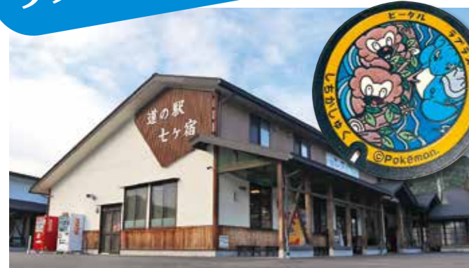
▲七ヶ宿町は「道の駅七ヶ宿」にポケふたがあるよ!

「みやぎ応援ポケモン」のラプラスと連携した特別企画として、宮城県内35市町村に設置されているポケモンが描かれた「ポケふた」をスタンプスポットにしたスタンプラリーを開催します。