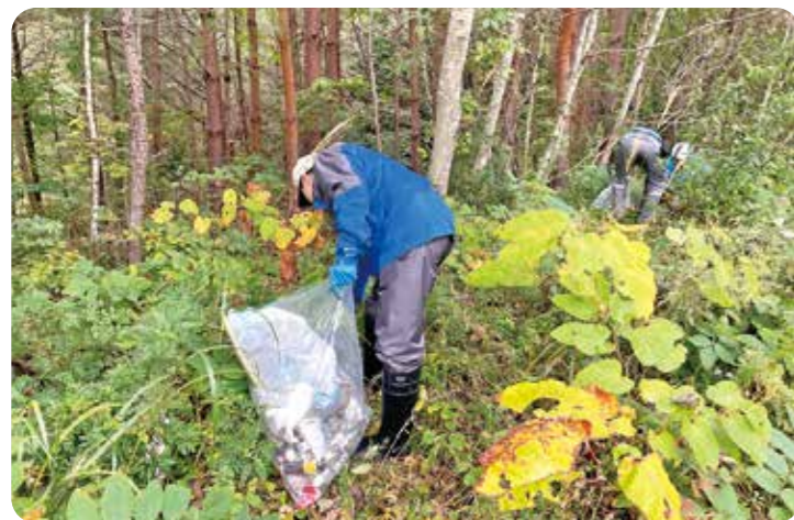
▲STOP！不法投棄！大切な水を守ろう！

10月18日、仙南・仙塩地域17市町の水がめである七ヶ宿ダムの水質保全活動として、クリーン作戦が開催されました。近年は新型コロナ対策として中止されていましたが、今年は5年ぶりの開催となり、県や関連市町等から総勢106名が参加しました。班ごとに担当箇所を振り分け、ダム湖畔のごみ拾いや不法投棄物を回収し分別作業を行いました。皆さんでマナーを守り、水源地の環境保全にご協力をお願いします。