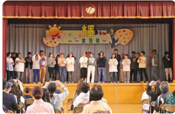
▲会場が一体となって盛り上がりました

10月6日に西山学院高等学校の文化祭が開催され、町内外から多くの方が集まりました。午前の校内イベントでは、作品展示や陶芸教室、お茶会、折り紙体験などが行われました。そのほか地場産品や手芸作品の販売も行われ、訪れた人たちを子どもから大人まで楽しませていました。午後には、体育館で全国大会に出場した飛龍団の和太鼓演奏などが披露され、日頃の取り組みの成果を大いに発揮しました。