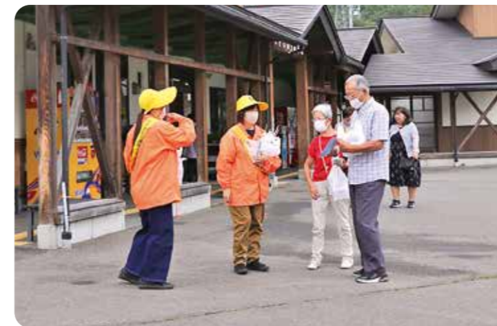
▲街頭キャンペーンの様子

9月21日から30日の間、秋の交通安全町民総ぐるみ運動が実施されました。出勤式では宮城県知事からのメッセージが朗読され、交通安全母の会連合会七ヶ宿支部会長より決意表明が行われました。28日には道の駅七ヶ宿にて、白石警察署ご協力のもと、街頭キャンペーンが実施されました。10日間の交通安全運動にご協力いただきありがとうございました。引き続き安全運転を心がけましょう。