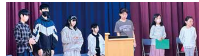
10/11(金) 第1学期終業式発表児童

「分からない。」という子供からよく聞く言葉ですが、人の成長過程では、とても大切な要素を含んでいる言葉なのだなと感じます。