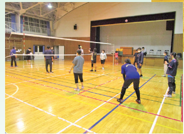
家庭バレーボール模擬試合!

スポーツ体験会で交流 9月28日を皮切りに、毎週スポーツ体験会を開催していきます。中学校体育館と峠田遊林館を隔週で回り、家庭バレーボール、ポッチャ、卓球、ポッチャと卓球バレーは、まだまだ町内では馴染みのないスポーツですが、簡単なルールなので子供もすぐに覚えてプレイすることができました。回を追うごとに参加者も増え、体を動かしながら幅広い年代が交流することができました。