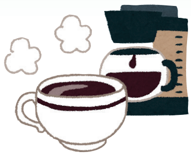
▲雪室珈琲を片手に交流しましょう

参加者募集！11月13日開催 七ヶ宿学々七ヶ宿の水を学ぶ旅 地域の魅力に目を向け、改めて体感してみませんか？白石川の源流である干蒲地区の「鏡清水」や滑津地区の大滝を巡りながら、ダム管理所に行き見学をします。また、やまびこの森キャンプ場内のカフェを会場に、七ヶ宿ブランドの雪室珈琲を飲みながら、お話をしてくつろぎタイムを過ごしましょう。町内はバスに乗って移動します。詳しくは、町の公式SNSや全戸配布のチラシをご覧ください。