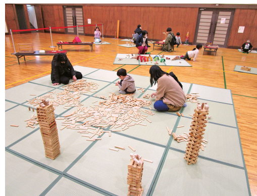
▲昨年度のオモチャ遊びのようす

親子ワークショップ開催 人形劇とオモチャのじかん 日時 11月23日(水・祝) 会場 活性化センター 対象 幼児〜小学校低学年児童とその保護者 内容 てんたん人形劇場さちによる人形劇上演+おもちゃで遊ぶワークショップを行います。親子でふれあひ、楽しい時間を過ごしましょう。会場には保育士さんもいますので、日頃の子育ての悩みや気になることを相談することも可能です。ぜひお気軽にご参加ください。ジュニア・リーダーも一緒に参加します！