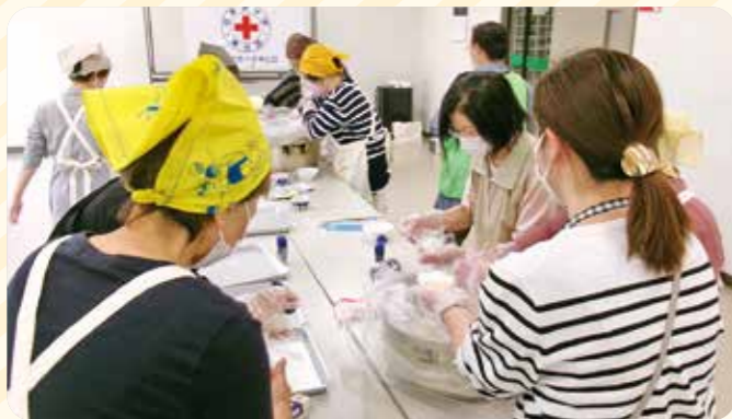
▲昨年の炊き出し訓練の様子

避難訓練(避難所開設等)や炊き出し訓練などが実施されます。平成23年に発生した「東日本大震災」の教訓をふまえて、多くの住民の皆さんに積極的な参加をお願いします。