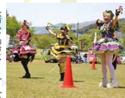
◀にゃんカスモンスター

最後は地元ボランティアをお手本に七ヶ宿音頭を踊り、参加者全員が一体感に包まれ、温かな余韻とともにイベントは幕を閉じました。