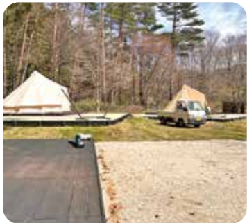
▲オープン準備の様子