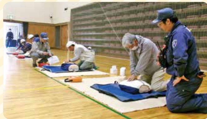
▲昨年の救護訓練の様子