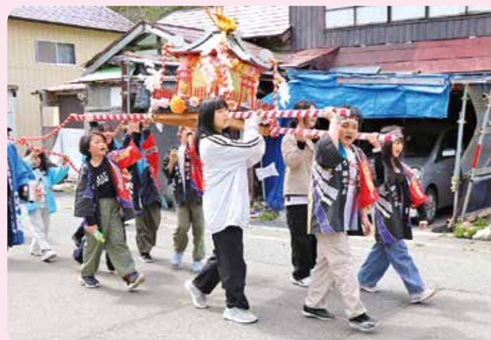
▲子供たちが元気いっぱいに神輿を担ぎました