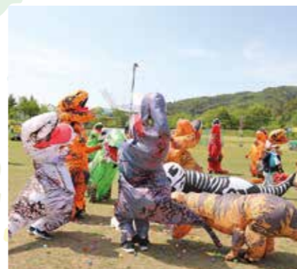
▲恐竜のたまご入れ