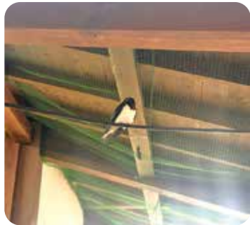
▲道の駅にいたツバメ