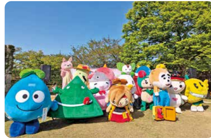
▲ゆるキャラの記念撮影の様子

4月26日、高畠町で開催された「たかはた春のキャラまつり」に、源流ポッチョンが出演しました。周辺の市町村からも多くのゆるキャラが集まった「まほろば国王決定戦」では、2チームに分かれてジェスチャー対決や借り物ミッションなどの対決を行い、会場を盛り上げました。ゆるキャラグッズの物販も行われ、限定商品などを買い求める来場者の姿が見られました。当日は約1万人が来場し、終日にぎやかな雰囲気になりました。