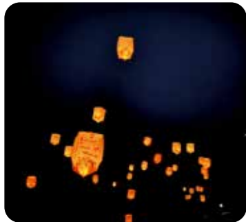
▲スキー場のイベント