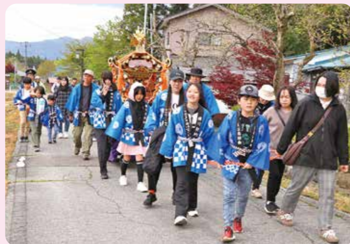
▲大きな神輿を引っ張りました