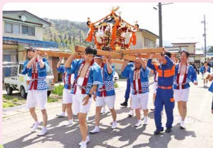
▲大人たちが力強く神輿を担ぎました

大人と子供、それぞれの神輿渡御が行われました。それぞれ大きな掛け声とともに神輿が担がれており、地区内が活気づいていました。