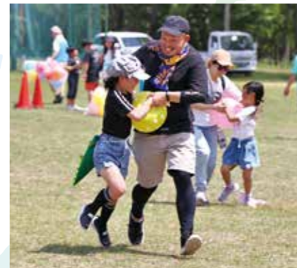
▲たまご運びレース