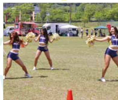
◀ベガルタ仙台チアリーダーズ