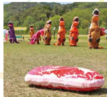
▲肉争奪サバイバル