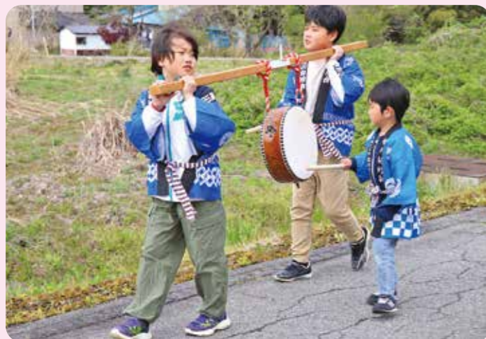
▲太鼓で掛け声のリズムをとりました

暖かい日差しのもと、神輿渡御が行われました。子供たちの太鼓のリズムにあわせて「わっしょい!」と掛け声をしながら、地区内を練り歩いていました。