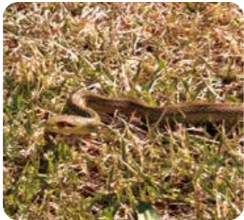
▲やまびこ場内にいたヘビ