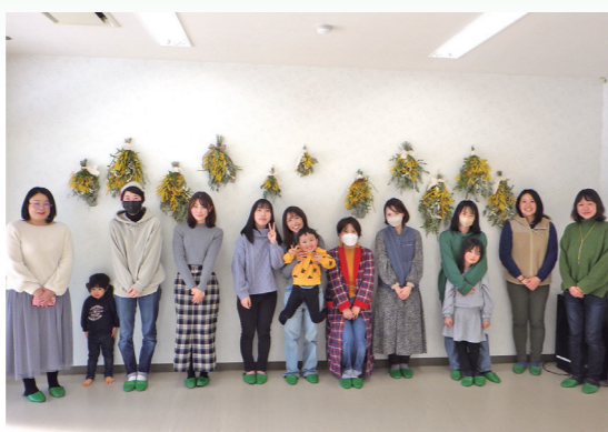
▲素敵なブーケに癒されました

なっていたいただき、春の訪れを告げるミモザと町で採れた植物等を組み合わせて制作しました。お互いの組み合わせ方を参考にしつつ、町での生活や子育てに関するお話に花が咲いていました。