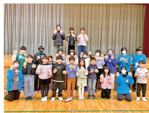
▲作品はORADAZUの節句に展示中