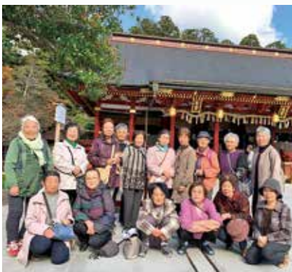
▲R3移動研修会 in 塩竈神社