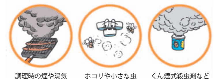
調理時の煙や湯気 ホコリや小さな虫 くん煙式殺虫剤など