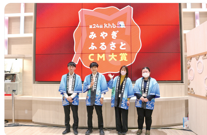
▲年明けの1月3日に放送予定です

11月15日、KHB東日本放送にて第24回みやぎふるさとCM大賞の作品審査会が行われました。今回は県内33市区町村の自治体に参加し、「ふるさと愛」のこもった30秒のCMを審査しました。当町は、「新しいことに挑戦できる町七ヶ宿」をテーマに、町内で新たなことに挑戦している人にフォーカスして、CMを制作しました。審査会の様子は1月3日に、KHB東日本にて放送されますので、ぜひご覧ください。