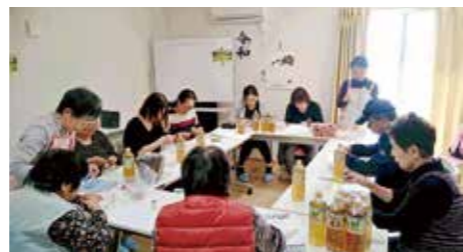
▲震災復興支援活動 そば枕作り「結いの手プロジェクト」