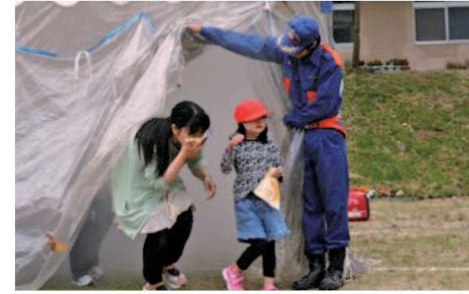
昨年の煙中通過訓練