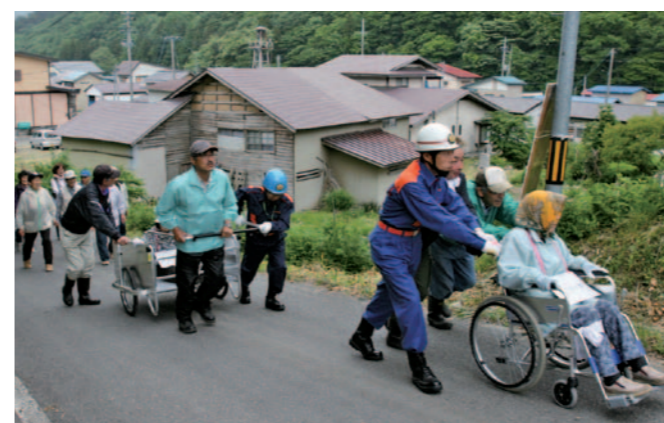
昨年の避難誘導訓練

避難訓練、初期消火訓練、救出・救護訓練、煙中通過訓練、炊き出し訓練などの訓練が実施されるほか、平成23年に発生した「東日本大震災」の教訓もふまえて、多くの地域住民の積極的な参加、参観をお願いします。(担当：総務課 奈良)