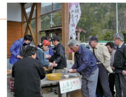
▲みそと相性が抜群の山菜汁は大好評でした

会場では採りたての山菜や特産品などが販売されたほか、「うど」や「うるい」、「タラの芽」などがたっぷり入った山菜汁が振る舞われるサービスは、来場者の方々にとっても好評でした。また、中には山菜汁の作り方を生産者の方に教わりながら山菜を買い求めるお客さんの姿もあり、今年のイベントも大成功で幕を閉じました。