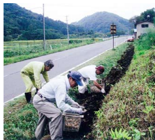
▲環境美化活動・すいせん球根の植栽作業（湯原集落）

これらの交付金は、各集落の協定に基づき総額の1/2以上〔関地区は7割〕を共同取組活動（水路、農道などの維持管理、農地の多面的機能を増進する活動や、集落の活性化に関する活動）に活用されます。残りの交付金は、農地の耕作者に面積に応じて支払われます。