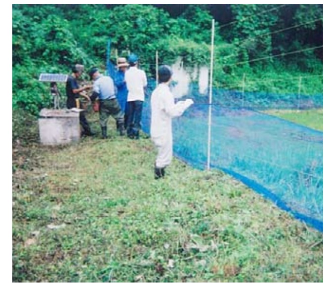
▲有害鳥獣防止対策・電気柵の設置作業（関集落）