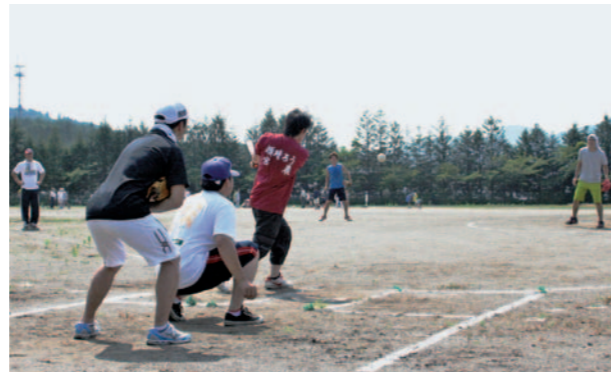
昨年のふるさとスポーツ祭の様子