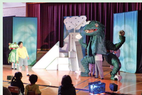
▲自分の心の中にいる魔物と戦う主人公

宮城県巡回小劇場 10月2日、七ヶ宿小学校体育館で劇団野ばらによる演劇「あした あさって しあさって」を鑑賞しました。感情を言葉にしなが、周りの人や動物たちにも思いやりを持って接しようというメッセージ性のある内容でした。様々な動物や虫のキャラクターも登場し、子供たちも時折笑いながら真剣な表情で演技に見入っていました。