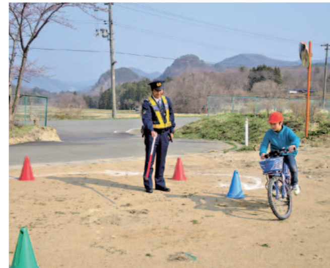
そう そう しっかり前を見て