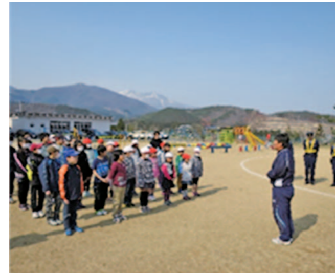
青空の下、緊張気味の交通安全教室

七ヶ宿小学校が開校して初めての行事とあって、子どもたちはちょっと緊張した様子で学んでいました。