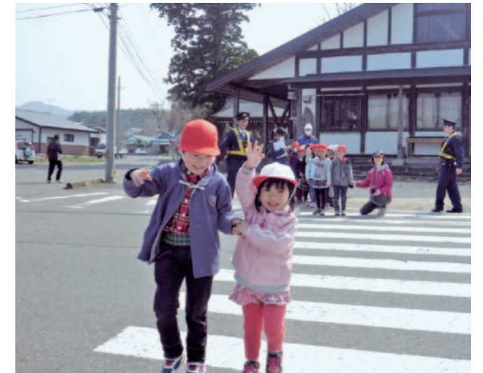
はい、いっしょに手を上げて渡ろうね