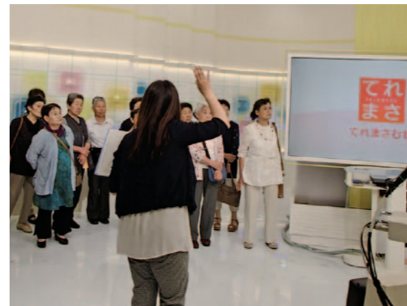
前年度の様子（NHK仙台放送局見学）