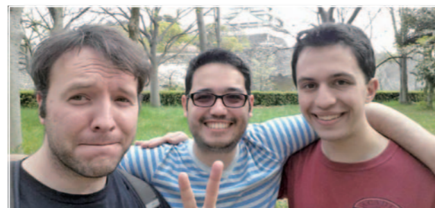
大阪城の前に三人の友達

最終日、一緒に関西空港に行って、お見送りをしました。友達はボストンに住んでいるので、8月僕がアメリカに帰ったら、よく会うかもしれません。