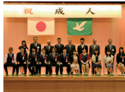
▲昨年の成人式の様子