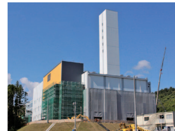
建設中の仙南クリーンセンター

角田衛生センターと大河原衛生センターでのごみの受入れは、平成28年11月30日で終了します。なお、動物死体の焼却については従来どおり角田衛生センターで行いますのでご注意ください。