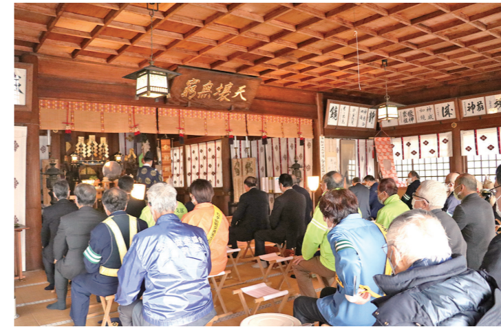
▲無事故祈願の祝詞が奏上されました

1月6日、白石市の神明社で新春祈願祭が行われました。この祭事は白石警察署管内の各交通安全機関・団体が集まり交通安全を祈願するもので、町からは交通安全協会、交通指導隊、交通安全母の会の代表者と町長が出席し、神前に玉串を捧げて今年一年の交通安全を祈願しました。現在県では「冬道の安全運転1・2・3運動」を展開中です。1割のスピードダウン、2倍の車間距離、3分早めの出発で交通事故の防止に努めましょう。