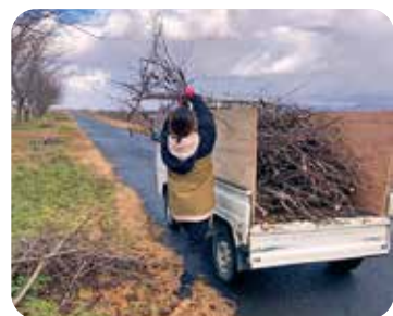
▲チャレンジ！桜の灰釉