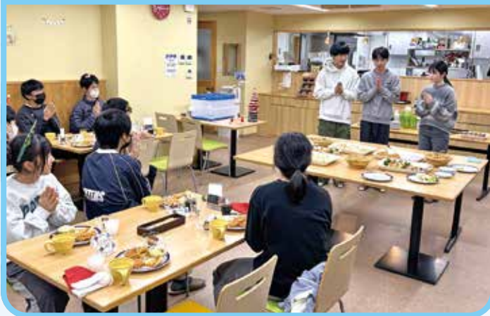
七中生とクリスマス会