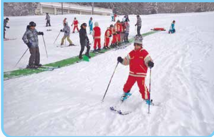
七ヶ宿スキー場でのスキー交流体験