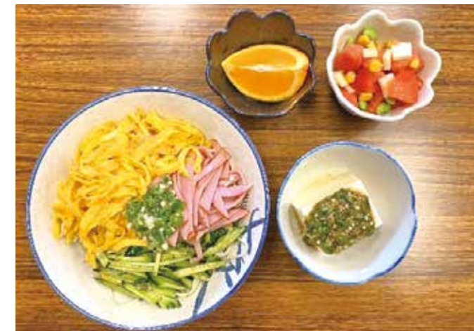
▲長老地区の伝達講習会「熱中症夏バテ予防メニュー」

食改会員につきましては随時募集しています。食と健康に興味がある方、入会をご希望の方は下記までご連絡ください。