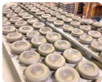
▲任期当初の練習品(笑)