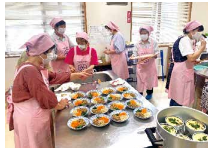
▲中央講習会の様子

令和7年度は、昨年に引き続き川崎町食改との交流会をはじめ、他市町村の食文化を知る移動研修会、食と健康について学ぶ中央講習会などを実施しました。今後もより一層、七ヶ宿町民の食生活と健康に寄り添えるように、食改活動の継続と発展を目指しています。