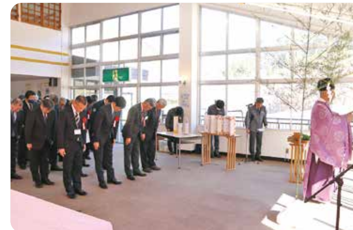
▲神事を行い、安全を祈願しました

12月19日、七ヶ宿スキー場にてオープン式が行われました。式では、多くのスキー場の関係者が集まり、シーズン中の安全を祈願し、テープカットとともにスキー場がオープンしました。オープン式当日は、積雪不足によりコース滑走をすることはできませんでした。スキー場は、3月22日まで営業予定で、シーズン中は、さまざまなイベントが開催されますので、ぜひ足を運んでみてください！