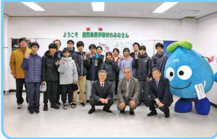
鹿児島県宇検村の皆さん