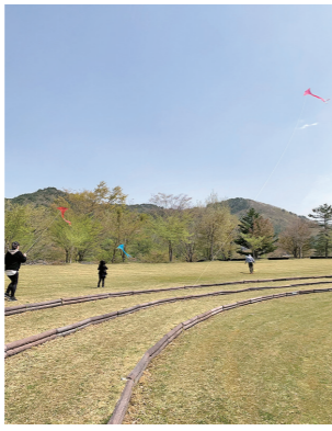
▲凧が揚がって大喜びでした

4月22日に、水と歴史の館を会場に「親子ふれあい凧づくり教室」を開催しました。端午の節句にちなんで、子供たちの健やかな成長を願い、手作りの凧を揚げて遊びました。今回は天気にも恵まれ、ダム公園の風を受けて凧を揚げることができました。