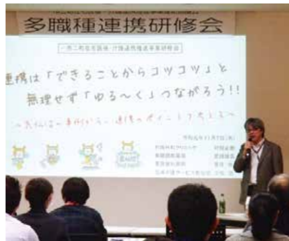
▲多職種連携研修会の様子

また、昨年11月7日には「多職種連携研修会」を公立刈田病院で開催しました。医療職と介護職の方約100人が参加し、医療・介護のネットワークの大切さを再認識しました。今後も協議会の理想像である「互いに助け合い、誰もが安心して、元気に暮らせるまち」の実現を目指し、在宅医療と介護の連携を深め、強化するための事業を進めていきます。